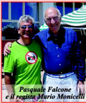
Pasquale Falcone e il regista Mario Monicelli

In particolare il Comune di Cava de' Tirreni, mercoledì 27 giugno, ha avuto l'onore di aprire i convegni dibattiti con un intervento di Falcone proprio sul cinema italiano Invisible.